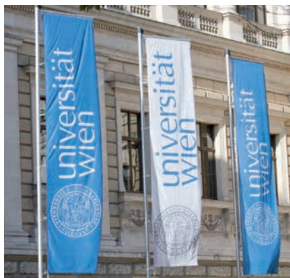
UNIVERSITÄT WIEN, HAUPTPORTAL