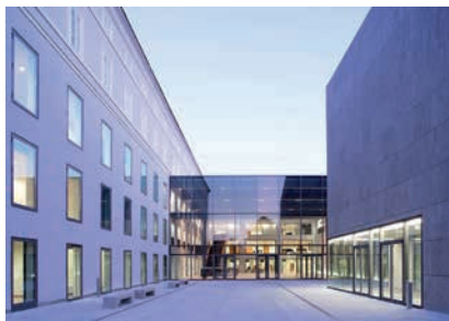
UNIVERSITÄT MOZARTEUM SALZBURG / © Christian Schneider

(7) Zu den Leistungen nach Abs.6 gehören außer bei ArbeitnehmerInnen der Verwendungsgruppe C insbesondere auch selbst-