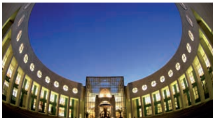
UNIVERSITÄT SALZBURG / © Scheinast