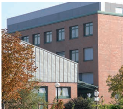
VETERINÄRMEDIZINISCHE UNIVERSITÄT WIEN

Zur Gruppe des Krankenpflegepersonals gehören ArbeitnehmerInnen nach § 5 Abs. 2