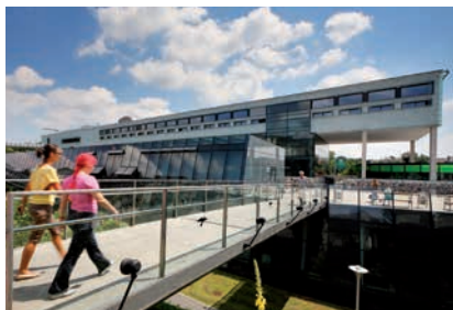
ZENTRUM FÜR MEDIZINISCHE FORSCHUNG (ZMF) DER MEDIZINISCHEN UNIVERSITÄT GRAZ

(12) Durch Betriebsvereinbarung können für