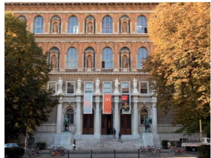
AKADEMIE DER BILDENDEN KÜNSTE WIEN