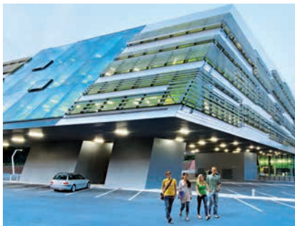
JOHANNES KEPLER UNIVERSITÄT LINZ, SCIENCE PARK

(1) ArbeitnehmerInnen nach § 5 Abs.2 Z 2, die an Sonntagen im Rahmen eines Schicht- oder Wechseldienstes beschäftigt werden