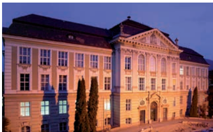
MONTANUNIVERSITÄT LEOBEN

merInnen, die bis 31. 10. 2009 einen Antrag auf Fahrtkostenzuschuss samt den erforderlichen Nachweisen gestellt haben, gelten bis 31.12.2009 die Vorschriften dieses Kollektivvertrages in seiner Stammfassung, wenn und solange die dort vorgesehenen Voraussetzungen erfüllt sind und der Fahrtkostenzuschuss nicht geringer ist als der sich nach Abs.1 bis 9 ergebende Betrag.