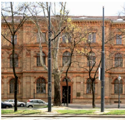
UNIVERSITÄT FÜR ANGEWANDTE KUNST WIEN / © faksimile digital/Kainz

(2a) Senior Artists sind künstlerische Mitarbeiterinnen, die nach Abschluss eines für die in Betracht kommende Verwendung vorgesehenen Master-(Diplom-) Studiums oder Doktorats-/Ph.D.-Studiums für eine nicht nur vorübergehende künstlerische Verwendung in Lehre und Entwicklung und Erschließung der Künste an der Universität aufgenommen werden. Entwicklung und Erschließung der Künste ist Erkenntnisgewinn und Methodentwicklung mit ästhetischen und künstlerischen im Unterschied zu wissenschaftlichen Erkenntnisprozessen, wobei künstlerisches Handeln das wesentliche Mittel dafür dar-