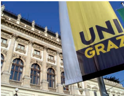
KARL-FRANZENS-UNIVERSITÄT GRAZ / © Uni Graz

(2) Abs.1 ist nicht anzuwenden, wenn die betreffende Person mit einer entsprechenden Kürzung ihres Entgelts einverstanden ist.