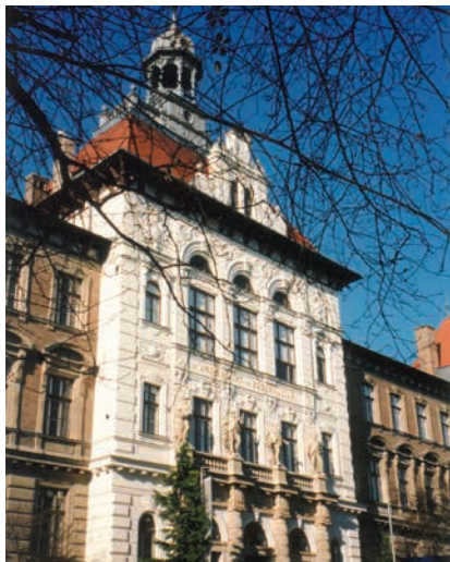
UNIVERSITÄT FÜR BODENKULTUR, MENDEL HAUS