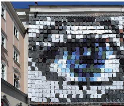
KUNSTUNIVERSITÄT LINZ (EYECATCHER – FASSADEN- GESTALTUNG ZUM TAG DER OFFENEN TÜR 2010) © Violetta Wakolbinger, Helga Traxler

den ausgedehnt werden, wenn sie innerhalb dieses Zeitraumes die Normalarbeitszeit gemäß Abs.1 nicht überschreitet. Der Durchrechnungszeitraum kann durch Betriebsvereinbarung auf bis zu 52 Wochen ausgedehnt werden. Die tägliche Normalarbeitszeit darf neun Stunden nicht überschreiten.