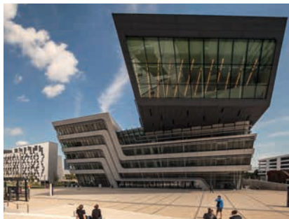
WIRTSCHAFTSUNIVERSITÄT WIEN / © Stephan Huger

(2) Bei der Beurteilung, ob eine Beeinträchtigung nach Abs.1 vorliegt, ist die Verbindung mit den fachlich in Betracht kommenden Bereichen in und außerhalb der Universität angemessen zu berücksichtigen. Der Begriff „wesentliche dienstliche Interessen“ kann durch Betriebsvereinbarung präzisiert werden.