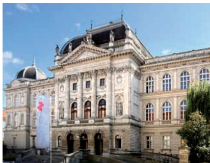
TECHNISCHE UNIVERSITÄT GRAZ, HAUPTGEBÄUDE, ALTE TECHNIK

(2) Abweichend von Abs.1 können Arbeits- verhältnisse, welche aufgrund einer Projekt- finanzierung durch Dritte begründet wurden, bereits nach einer Dauer von zumindest 18 Monaten gekündigt werden, wenn der Wegfall oder die Reduzierung der Projektfinanzierung durch Dritte einer Beschäftigung nicht nur vor- übergehend entgegensteht. Das Arbeitsver- hältnis kann unabhängig von der vereinbar-