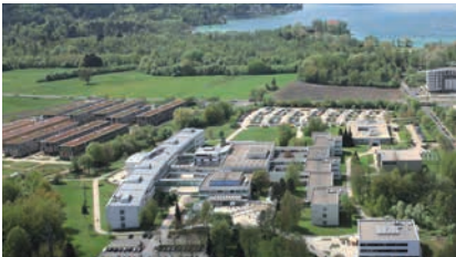
ALPEN-ADRIA-UNIVERSITÄT KLAGENFURT

(10) Die Vorschriften der Abs.1 bis 9 gelten rückwirkend ab 1. 10. 2009. Für Arbeitneh-