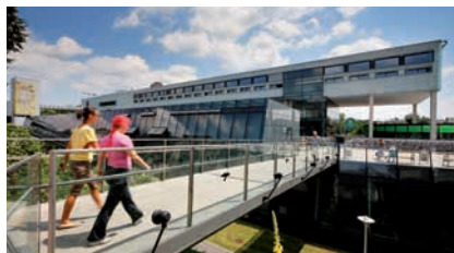
ZENTRUM FÜR MEDIZINISCHE FORSCHUNG (ZMF) DER MEDIZINISCHEN UNIVERSITÄT GRAZ

des monatlichen Bruttoentgeltes der Verwendungsgruppe IIIb/Regelstufe 1 (§ 54) beträgt. Bei Teilzeitbeschäftigung gebührt die Zulage aliquot.