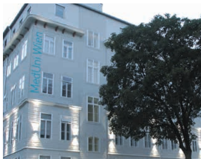
MEDIZINISCHE UNIVERSITÄT WIEN

(10) ArbeitnehmerInnen nach Abs. 2 haben