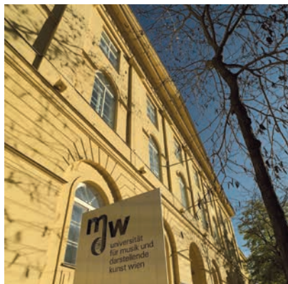
UNIVERSITÄT FÜR MUSIK UND DARSTELLENDEN KUNST WIEN

(7) Samstage, Sonn- und Feiertage sind dienstfrei zu halten, wenn kein wichtiger dienstlicher Grund entgegensteht. Die ArbeitnehmerInnen haben die Arbeit so ein-